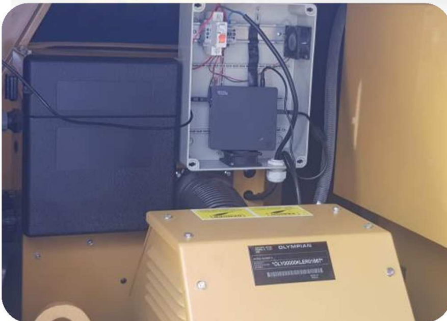
FOTO 2 : DETALHE DO SISTEMA DE MONITORAMENTO REMOTO INSTALADO EM TODOS OS GERADORES DE ENERGIA DA FEA..